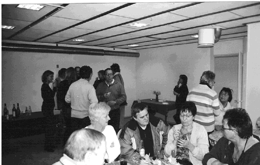
Indvielse af det nye beboerhus