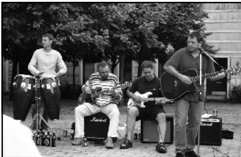
Musik på Brogårds plads