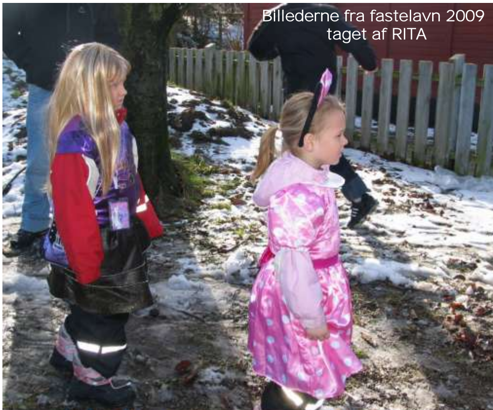
Billederne fra fastelavn 2009