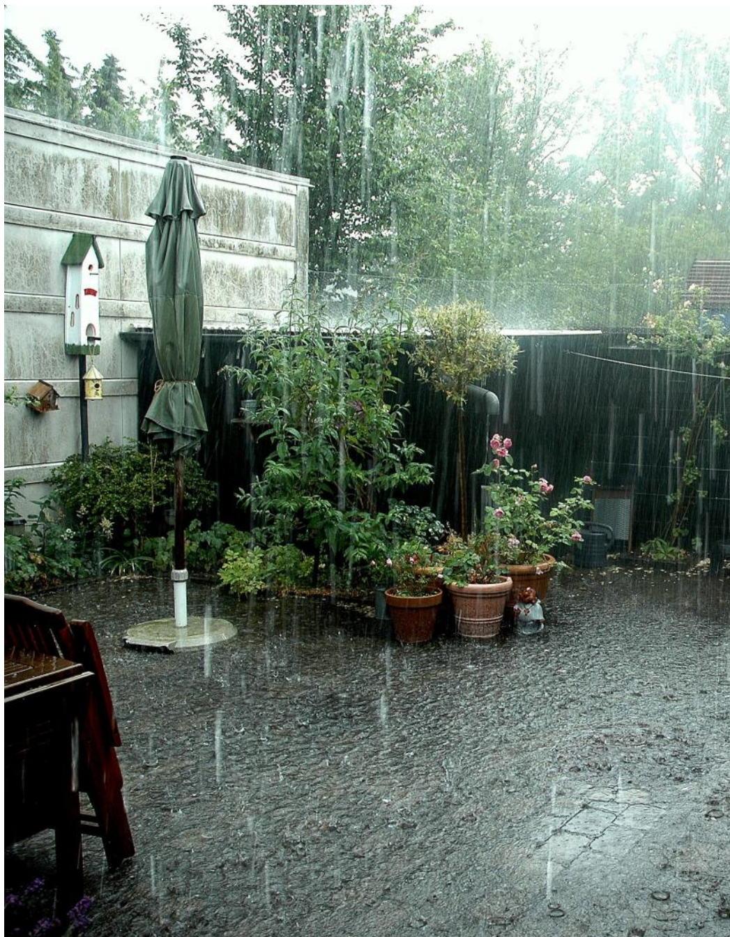
Vinderen af ABC fotokonkurrencen (se side 11) blev Tommy Jørgensen med