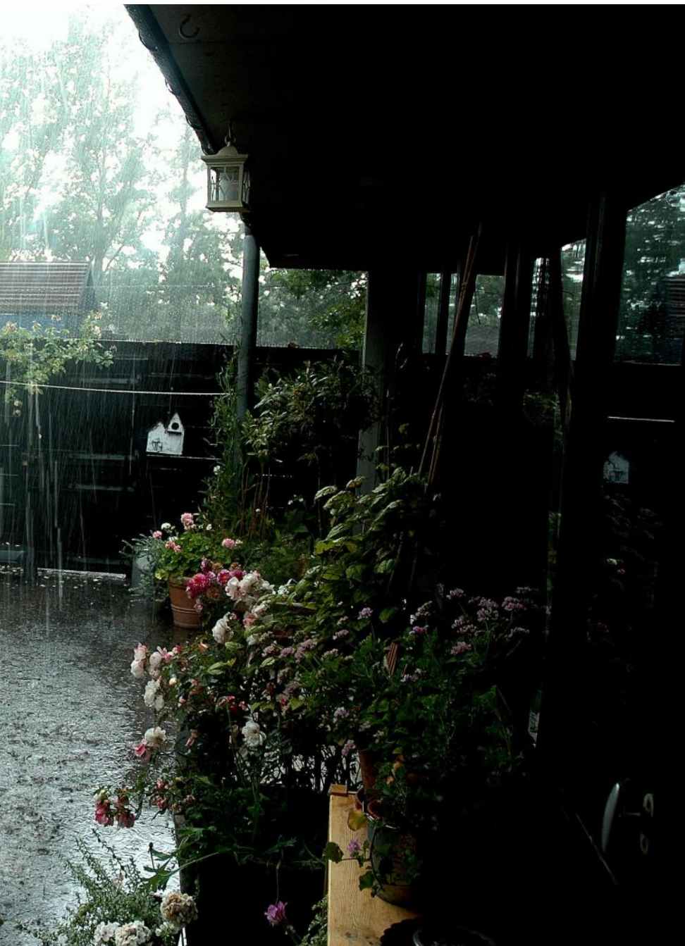
et billede af hans gårdhave en regnvejrsgang.