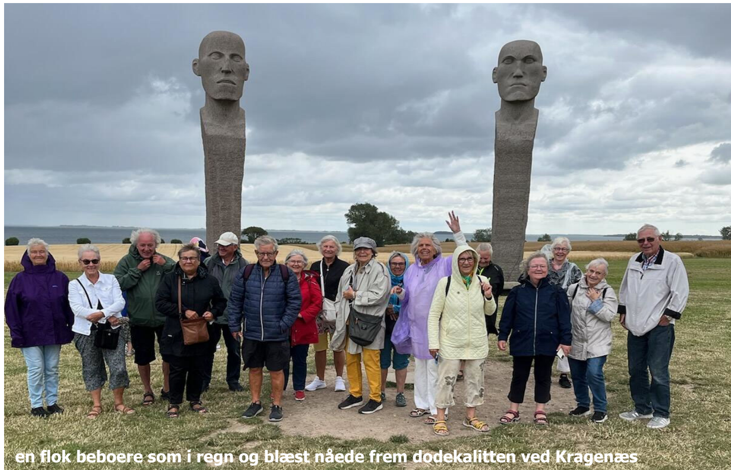
en flok beboere som i regn og blæst nåede frem dodekalitten ved Kragenæs