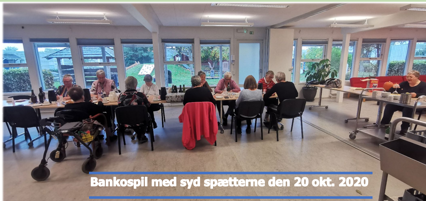
Bankospil med syd spætteerne den 20 okt. 2020